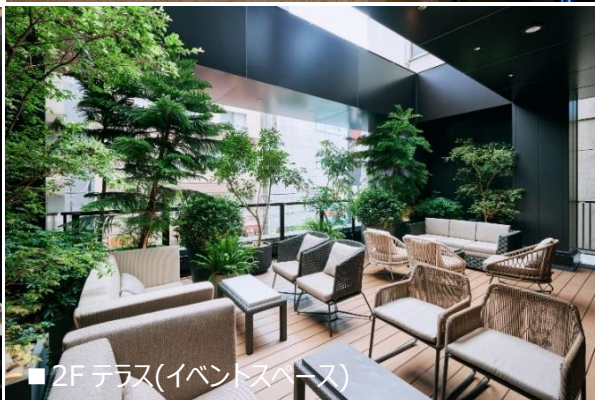
■2Fテラス(イベントスペース)