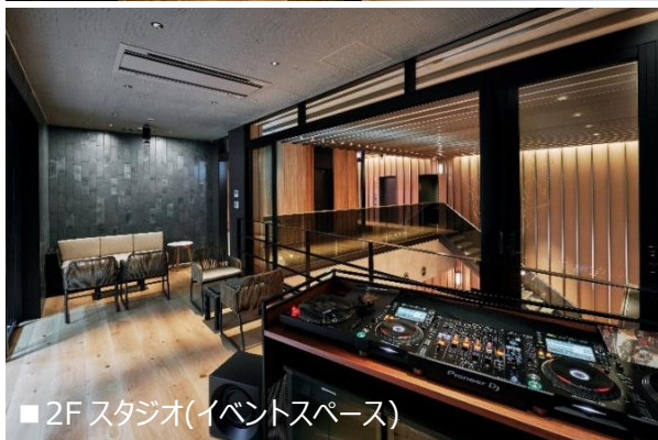
■2Fスタジオ(イベントスペース)