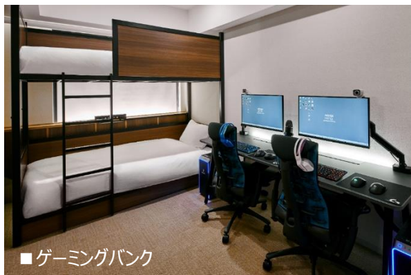
■ゲーミングバンク