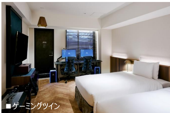
■ゲーミングツイン

野村不動産ホテルズ株式会社（本社：東京都新宿区/代表取締役社長：青木秀友）が運営する NOHGA HOTEL AKIHABARA TOKYO（以下「ノーガホテル秋葉原」）は、ホテルコンセプトである「地域との深いつながりから生まれる経験」を元に地域連携を図っており、日本を代表する e スポーツ店舗が集積する秋葉原にて、e スポーツを体験できるゲーミングルームを 1/27(木)より新たに販売することをお知らせいたします。